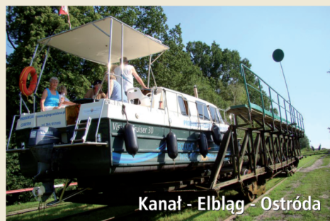
Kanał - Elbląg - Ostróda

J. Jeziorak najdłuższe jezioro w Polsce. Ciekawe rezerwy ornitologiczne