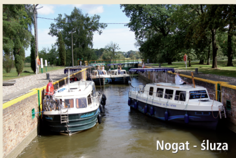
Nogat - śluza